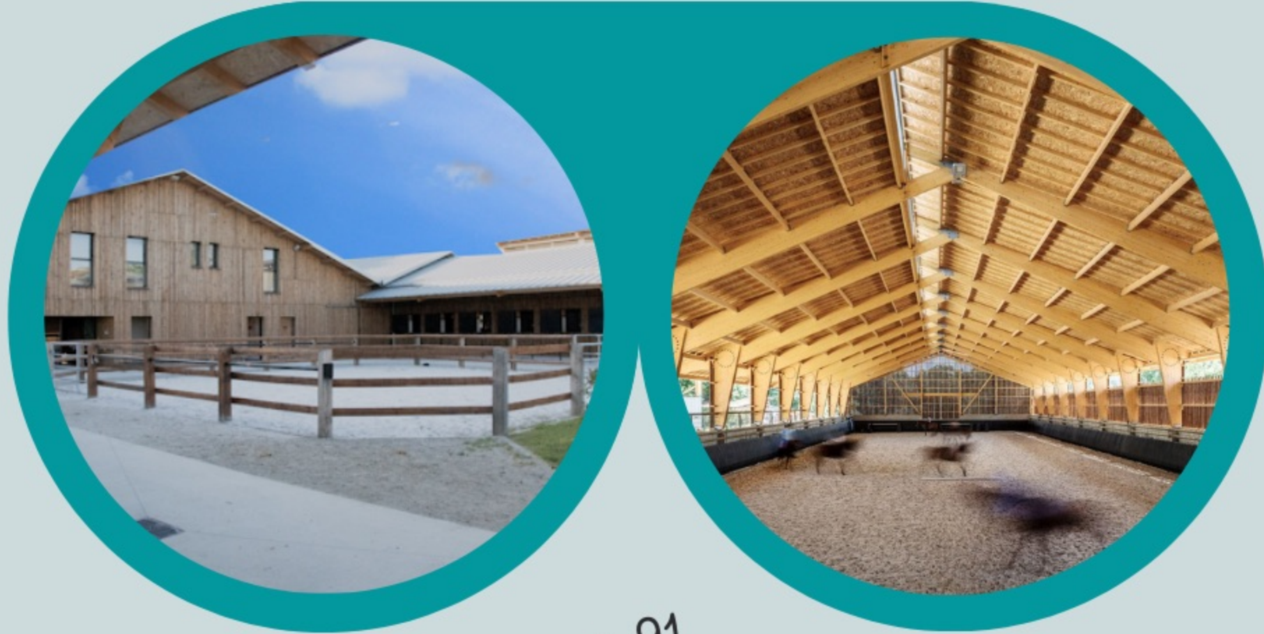
Montéclin à Bièvres, 91

Vous préférez la campagne ? Alors venez à Bièvres ! Nous vous accueillons dans un cadre chaleureux, avec nos quarante poneys shetlands, notre grand manège et surtout l'accès direct à la forêt ! Un parcours d'accrobranche est installé sur notre domaine, pourquoi pas combiner deux activités ?